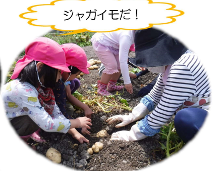
▲ミミズ発見♪それも楽しい♪