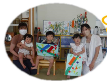
みんなで遊ぶと楽しいね♪