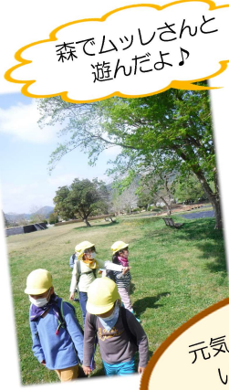
森でムッシさんと遊んだよ♪

春は野外に出かけ、自然の中で遊びました。畑では元気クラブさんと一緒に植えた夏野菜がどんどん収穫できるようになりました。年間通して元気クラブさんにはお世話になっています。本当にありがとうございます。